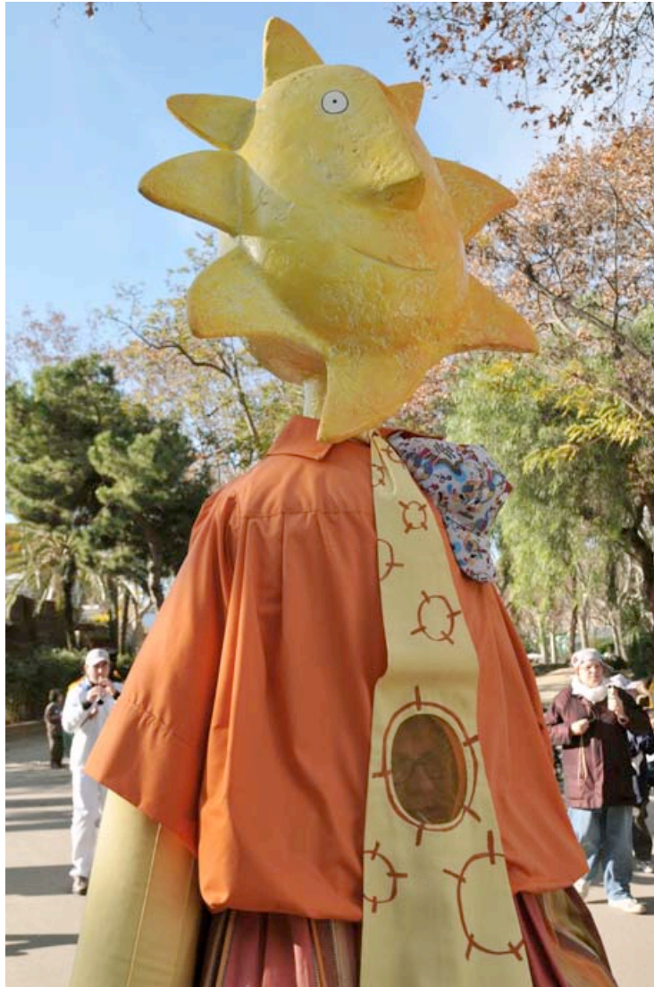
ANIMACIÓ ITINERANT. DESEMBRE 2012. AUTOR: OLIVER ADELL