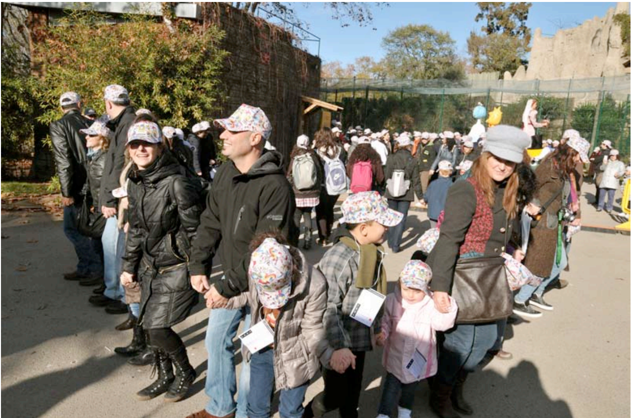
POSA'T LA GORRA. AUTOR: ERNEST GUAL

NECESSITEM EL VOSTRE SUPORT QUE ENS RESULTA IMPRESCINDIBLE PER ASSOLIR LES NOSTRES FITES.