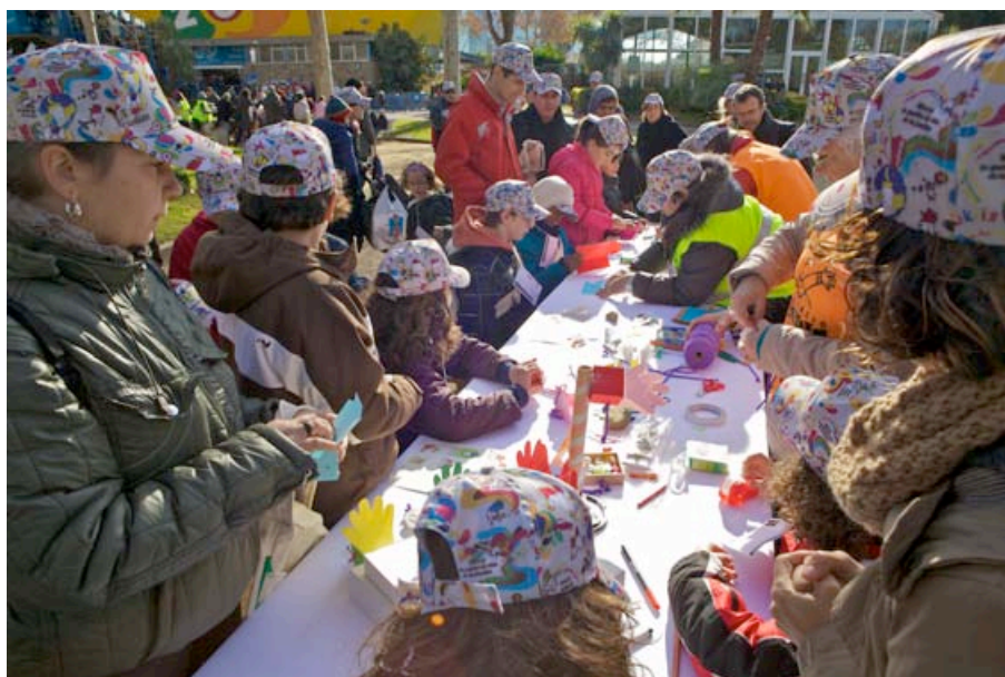
TALLER DE PAPIROFLÈXIA I ESCENARI GRAN. DESEMBRE 2012. AUTOR: ERNEST GUAL