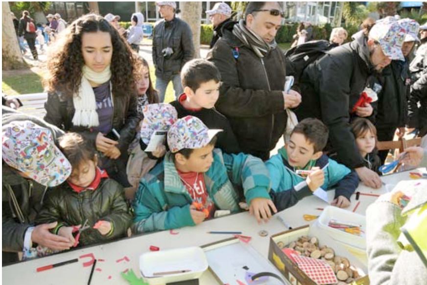
TALLER DE MANUALITATS I CEL DELS DESITJOS. DESEMBRE 2012. AUTOR: ERNEST GUAL

A més a més, els nens i nenes i les seves famílies podran gaudir d'un seguit de tallers i activitats per tot el parc i molt més! Al fer-los, participaran d'una gimcana amb la que se'ls hi farà entrega al final d'un diploma i un obsequi.