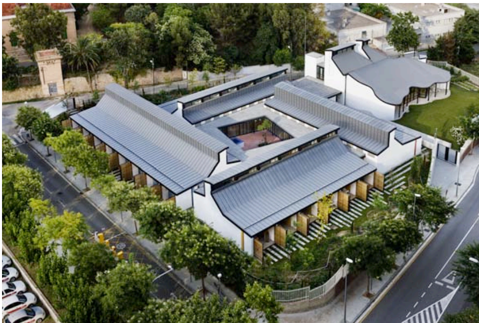
LA CASA DELS XUKLIS. AUTOR: ENRIC DUCH

Fruit de les darreres edicions hem pogut dur a terme l'acondicionament del Servei d'oncohematologia de l'Hospital Maternoinfantil de la Vall d'Hebron, l'obertura de la delegació d'AFANOC a Tarragona i la seva ampliació, i hem obert les portes de la Casa dels Xuklis.